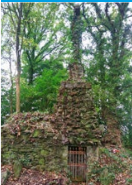
L'ENCLOSE ♦ SOUDAN

Cet oratoire a été édifié fin XIXe pour abriter la Pietà de l'ancienne église de Châteaubriant. L'eau de son puits aurait des vertus miraculeuses.