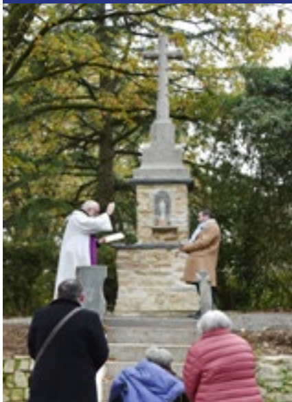
BEAUCHÊNE ♦ ERBRAY

Calvaire construit en 1854 par la famille Gobbé du village de Beauchêne. Il aurait été édifié sur un ancien site mégalithique. La croix d'origine en schiste a été remplacée par la croix actuelle en granit datée de 1899.