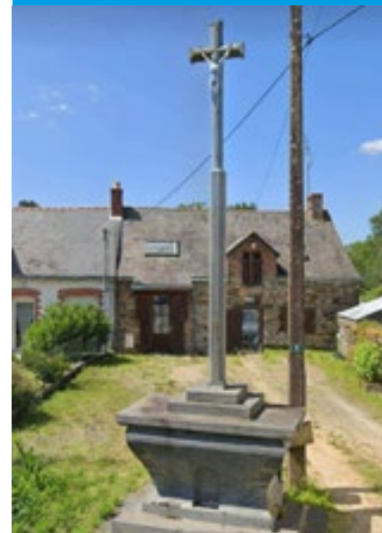
L'ORME ♦ SAFFRÉ

La croix située au lieu-dit L'Orme, avait été démontée par ses propriétaires. L'association Saint-Patern s'est investie pour sauvegarder le calvaire : il sera reconstruit sur un terrain privé à La Bouzenais.