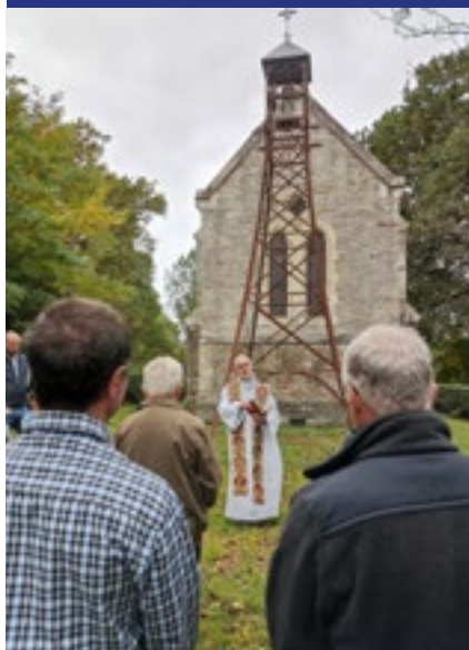
LA GALOTIÈRE ♦ LUSANGER

Cette cloche datée de 1637, provient de l'ancienne église du vieux bourg de Lusanger.