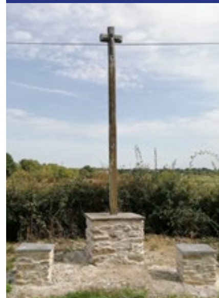
LA BARILLERIE ♦ RIAILLÉ