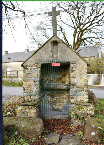
BEAUCHÊNE ♦ ERBRAY