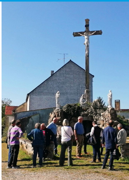
RUE DU CALVAIRE ◆ VILLEPOT