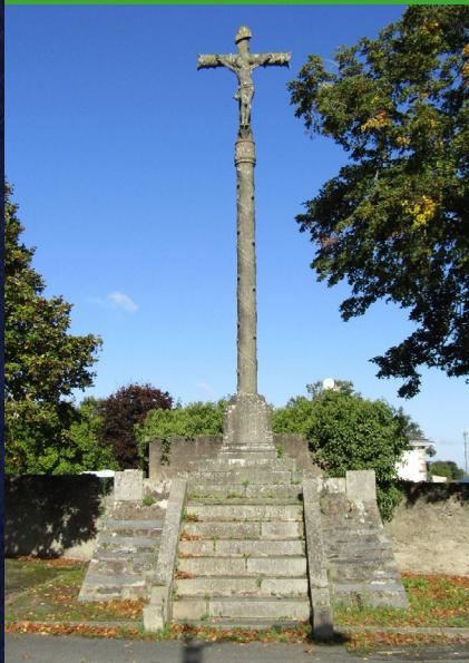
PLACE DU CHAMP DE FOIRE ♦ RIAILLÉ

La croix en granit de Kersanton est l'œuvre du sculpteur Yves Hernot de Lannion, spécialisé dans la création de calvaires. Elle a été bénie le 4 octobre 1896 comme en relate le registre paroissial de Riaillé, et a été érigée en remplacement d'une précédente croix de mission brisée lors d'une tempête. Nettoyage et restauration du calvaire suite à la demande de la municipalité de Riaillé.