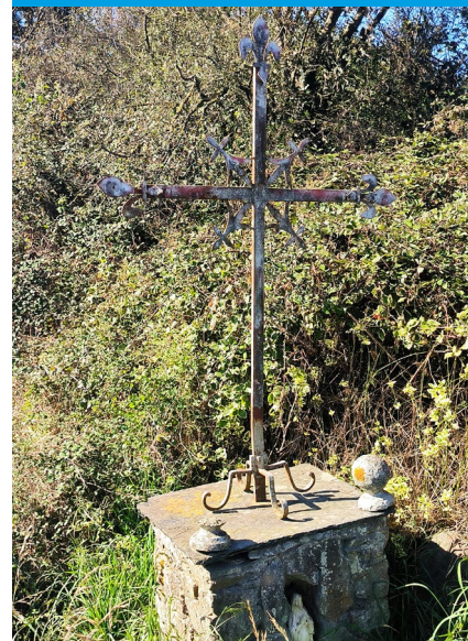
LES SOUCIS ◆ VILLEPOT

Notre assemblée générale annuelle s'est déroulée le 30 septembre 2023 à Villepot.