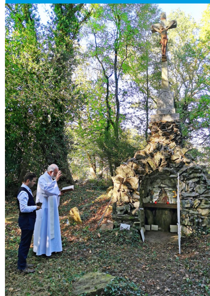
L'ENCLOSE ◆ SOUDAN