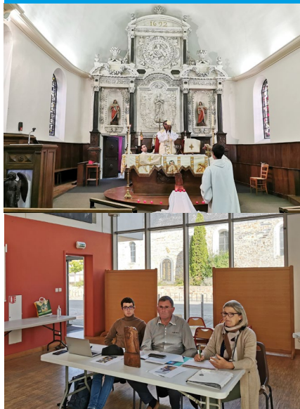
SALLE MUNICIPALE ◆ VILLEPOT