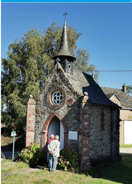
LES JARILLAIS ◆ VILLEPOT

Cette petite chapelle est située sur la route de Soudan, à 500 m du bourg de Villepot. Construite au XIX e siècle pour y abriter une statue en bois de la Vierge. Tombée en ruine fin XIX e , elle a été restaurée courant XX e .