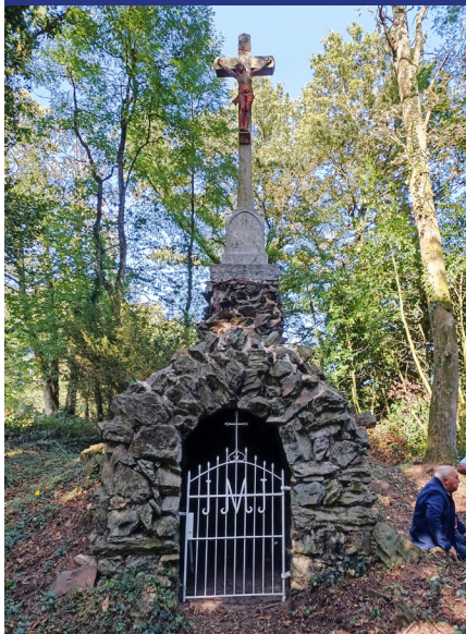
L'ENCLOSE ♦ SOUDAN

Cet oratoire est situé sur la commune de Soudan au lieu-dit L'Enclose, qui se trouve à 500 m du lieu-dit Saint-Patern où existait un prieuré aujourd'hui disparu. Il a été édifié fin XIX e pour abriter la Pietà de l'ancienne église Saint-Nicolas de Châteaubriant.