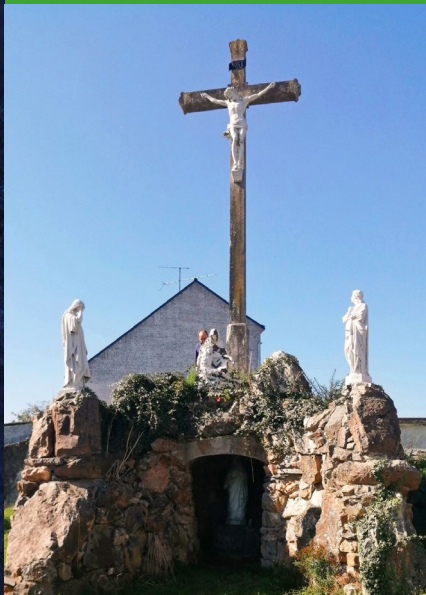
RUE DU CALVAIRE ♦ VILLEPOT