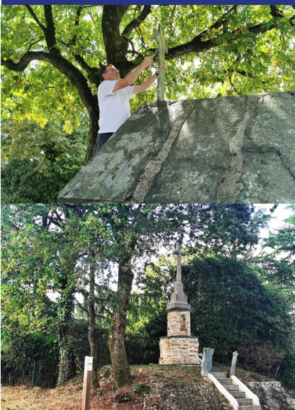
BEAUCHÊNE ♦ ERBRAY

Des travaux d'entretien ont été réalisés sur divers sites, dont le calvaire de Beauchêne construit en 1854.