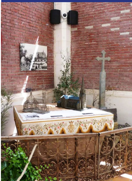
MARCHÉ COUVERT ♦ CHÂTEAUBRIANT

L'exposition Patrimoine et Paysages au marché couvert de Châteaubriant du 1 er juillet au 31 août 2023, a sollicité l'association pour exposer une grille d'autel et une croix en schiste. Exposition organisée par la Communauté de Communes Châteaubriant - Derval.