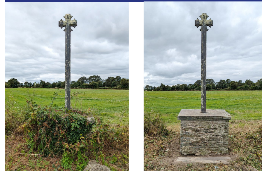
LA BEAUBRESSAIS ♦ ISSÉ