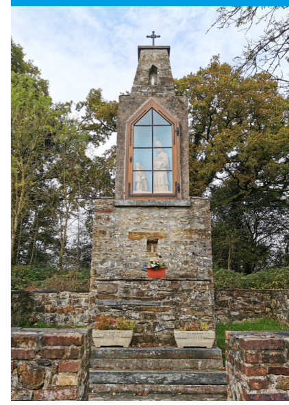
LA GRÉE POTHIN ♦ ROUGÉ