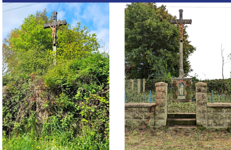
LA HECHE ♦ VILLEPOT

Voici un autre exemple de croix complètement envahie par la végétation.