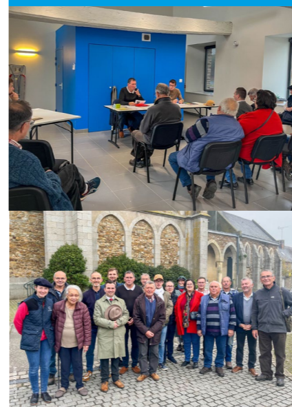
SALLE DE LA RIVELAINE ♦ ROUGÉ