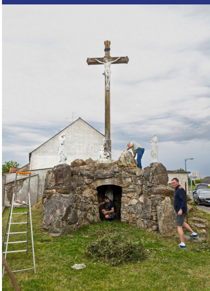
LE BOURG ♦ VILLEPOT