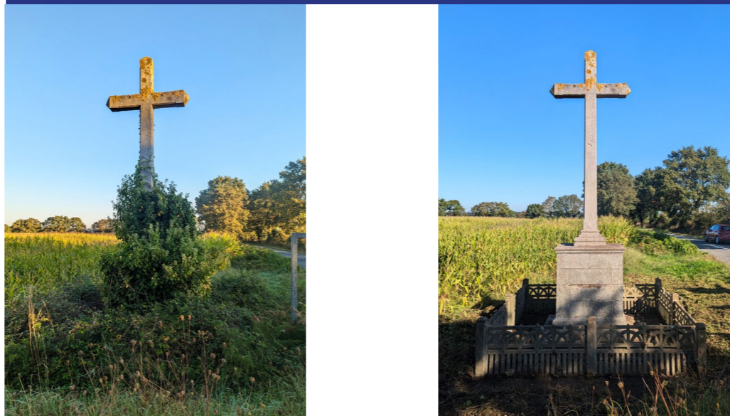
LA PIERRE ♦ LUSANGER

La croix de La Pierre est située à la sortie de Lusanger sur la D775 en direction de Derval, juste après le restaurant La Diligence. Cette croix en béton était complètement envahie par la végétation. Elle a retrouvé sa splendeur avec son petit enclos en ciment.