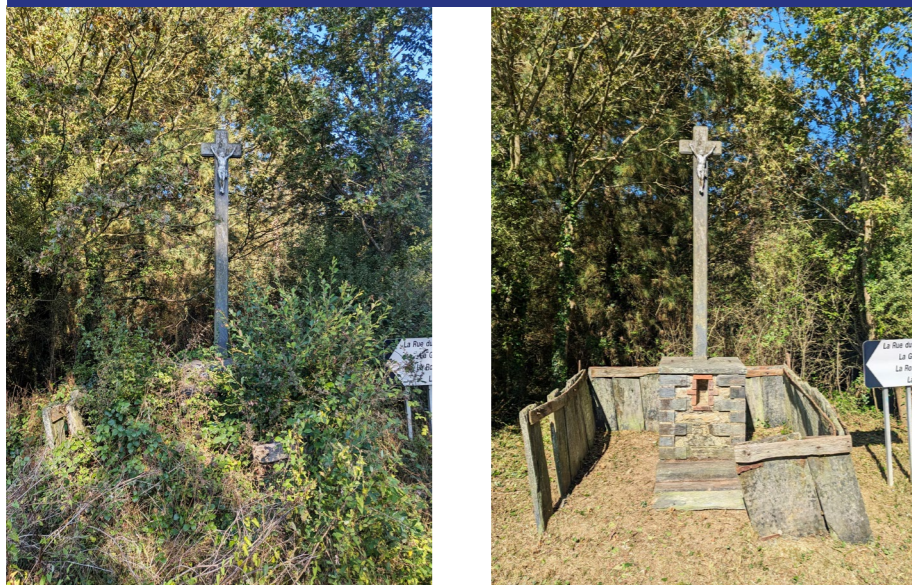
LA RUE DU BOURG ♦ LUSANGER

Tout au long de l'année, notre équipe de bénévoles a défriché de nombreuses croix laissées à l'abandon et continué à entretenir celles déjà restaurées. Nous vous présentons ici quelques exemples significatifs.