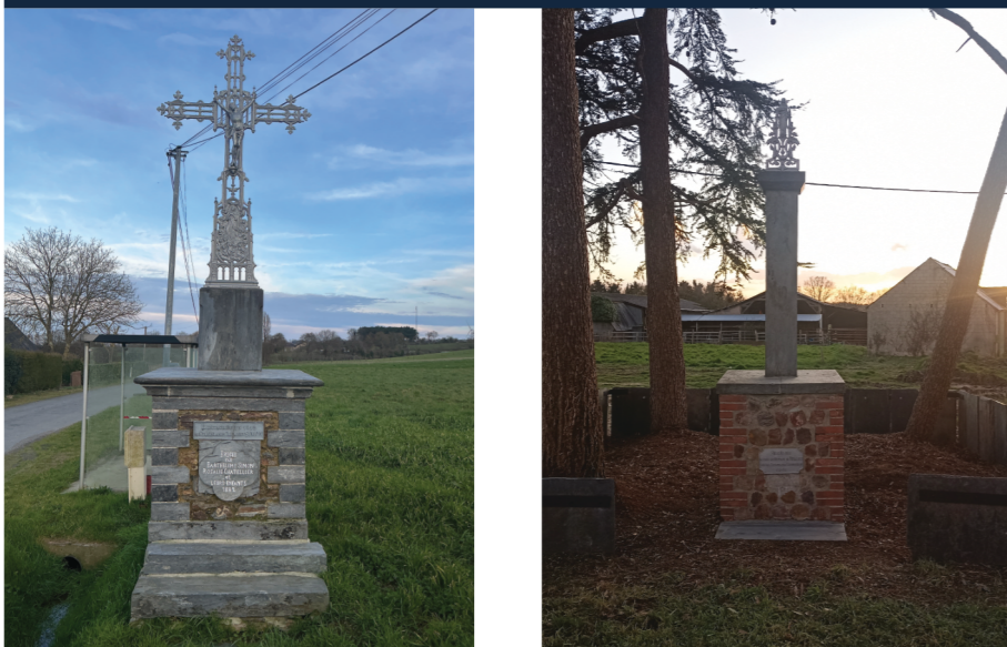
CROIX SIMON CHATELLIER | CROIX DE BEAUMONT ❖ ISSÉ