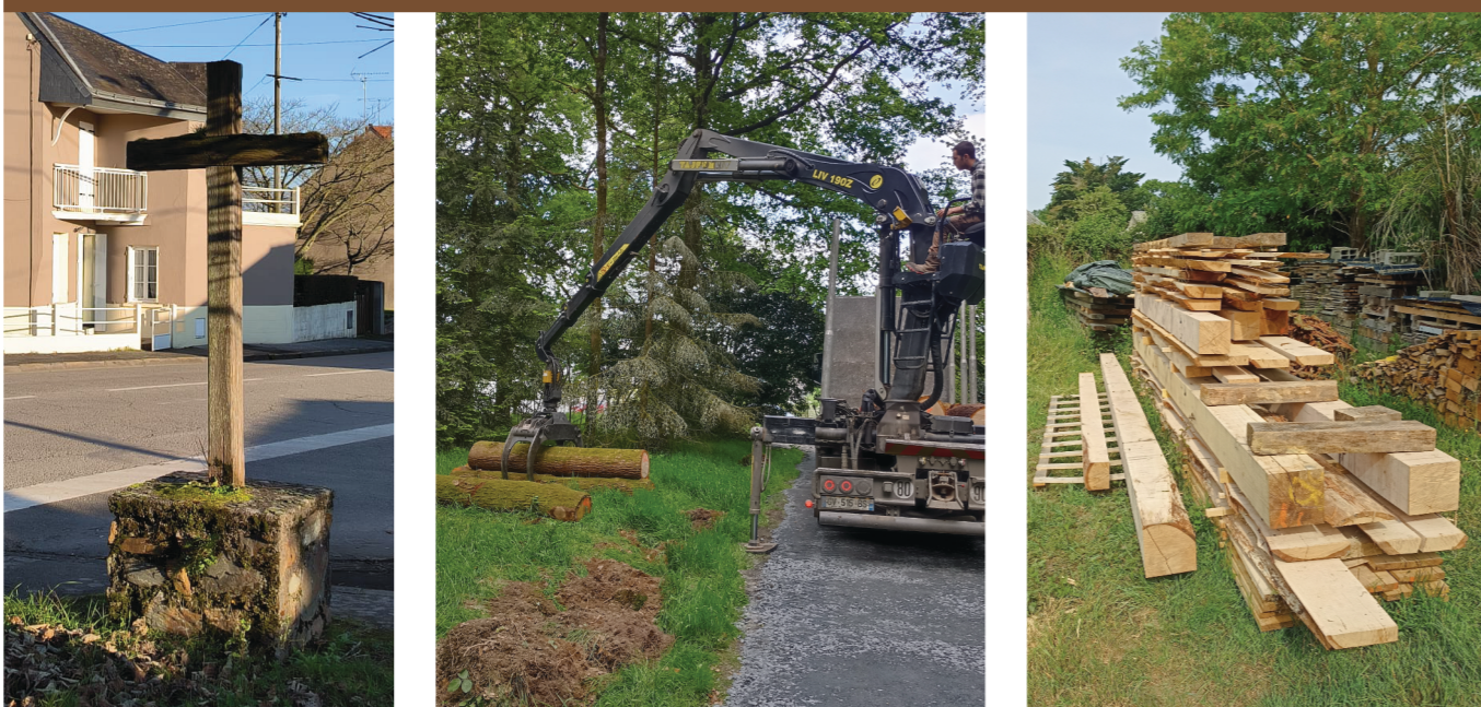
LES PREMIÈRE ÉTAPES DE LA FABRICATION DE LA NOUVELLE CROIX