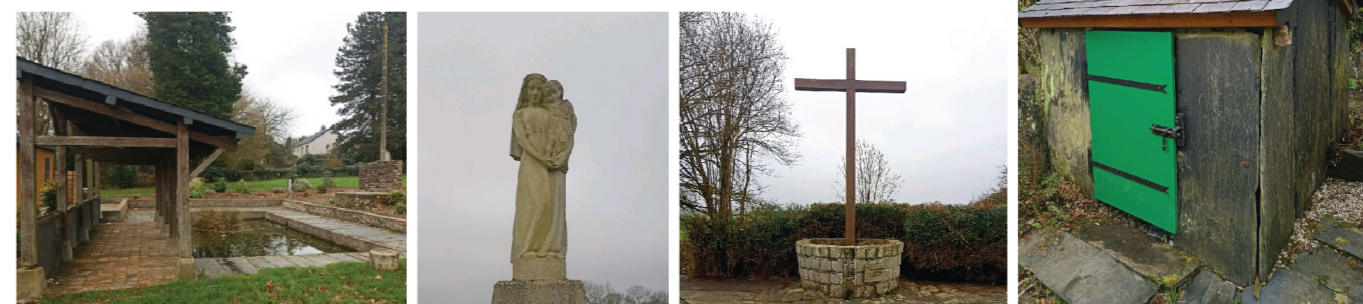
LAVOIR &amp; VIERGE DE NOIRE | CROIX DE MISSION | BIQUETTERIE ❖ LA MEILLERAYE-DE-BRETAGNE